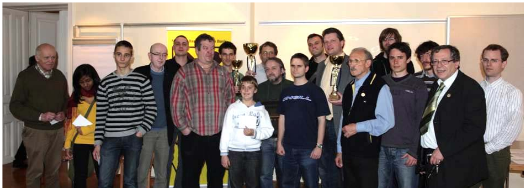
Siegerehrung mit allen Preisträgern