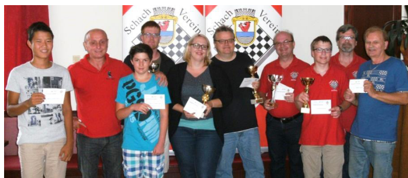
Die Preisträger und der Schiri